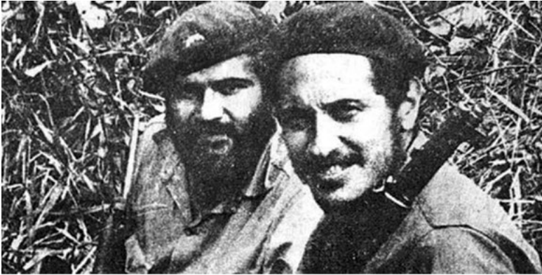
Figura 4. Revive el misterio de los restos del cura guerrillero Camilo Torres.

bases del ELN (Lozano, 1989). De modo que, las acciones de estos miembros en los inicios del grupo incrementaron el discurso donde se planteaba que el socialismo sería la única vía para mantener la paz en los territorios de los países, especialmente en América latina, tomando como ejemplo las acciones que se presentaron en Cuba (Duque, 1992).