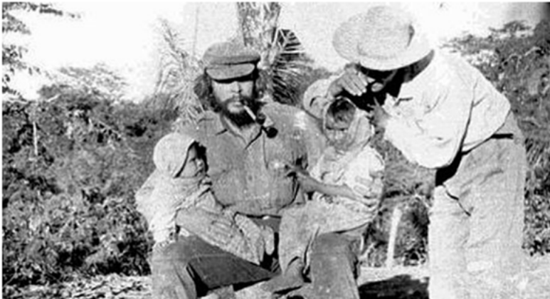
Figura 6. La muerte como una Saeta.

lo iniciaron, sino que, al mismo tiempo, estos generaron una unión de las teorías principales y la adaptación de estas al contexto, con lo cual su actuar podría responder de forma eficiente a las necesidades que se reconocen y las formas de actuar de la sociedad (Celis, 2021). Esta apropiación es una derivación básica que hace el ELN de la guerra de guerrillas, a partir de la adaptación realizada por el mismo Ernesto Guevara (Canal Institucional, 2017).