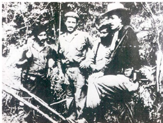
Figura 1. 'Cabino' relata cómo el ELN se tomó Simacota hace 55 años.

En tercer lugar, a partir de la violencia política que se presentaba en la época, se generó el Frente Nacional a modo de respuesta, en el que se establecía un acuerdo de alternancia de poder entre los partidos tradicionales, en este caso el Partido Liberal y el Partido Conservador. Esto trajo un periodo de paz política que permitió un cese a la violencia masiva en todo el país. También impulsó que en muchas zonas se presentaran nuevos discursos de todas partes del mundo, en los cuales se impulsaban nuevos modelos para gobernar los países (Caballero, 2016).