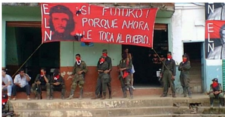
Figura 7. Las guerrillas en Colombia: dudas y respuestas a una realidad compleja I.

De lo anterior se infiere cómo el foco revolucionario expuesto por Guevara comprende que para que se den todas las condiciones necesarias para la revolución todo es un proceso sistemático y de tiempo, es decir, no se puede creer que todos los procesos de conciencia, educación y aceptación social, entre otros, se den en un solo momento con la creación del primer foco guerrillero.