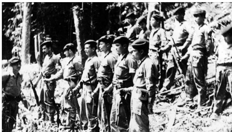
Figura 2. El ELN cumple mañana 50 años.

El anterior recorrido histórico permite entender cómo las condiciones a nivel mundial propiciaron que se gestaran las guerrillas para este periodo en Colombia; puesto que la realidad internacional presentó múltiples teorías respecto de las nuevas formas de ejercer el poder, esto sentó las bases doctrinarias e ideológicas para el establecimiento de grupos como el ELN.