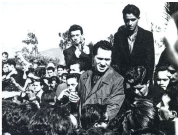
Figura 8. Camilo, el cura guerrillero.